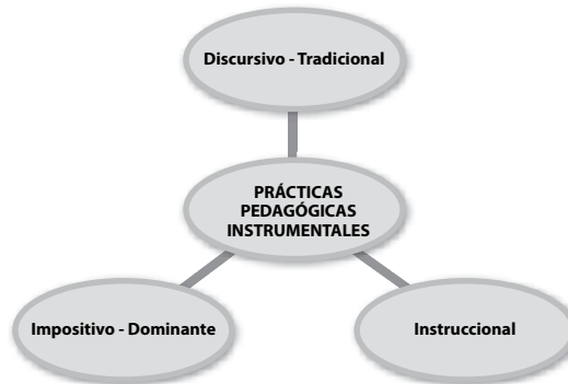
Gráfica 4.

Se establece por ser de carácter totalizante, determinista y reduccionista en cuanto a su grado de sujeción a ideologías impositivas y dominantes, que mantiene presente la formación bancarizante, para el hacer en cuanto al discurso tradicional de la práctica pedagógica repetitiva, que se sustenta en la guía e instrucción como método de preferencia para transmitir conocimiento.