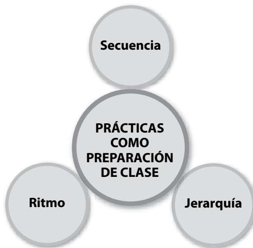
Gráfica 5.

La práctica pedagógica se entiende como un hacer con sentido, por medio del cual se consideran las secuencias y ritmos de aprendizaje, siendo explícitos en la mayoría de casos para el docente e implícitos para el estudiante. De otra parte, la secuencia marca la lógica del proceso de aprendizaje y el antes y después de tal proceso siendo, en consecuencia, proporcional en razón a su lógica de formación. Finalmente, aparece la subcategoría de jerarquía que determina las condiciones de orden social, de carácter y de modales, así como las relaciones de poder, desde la subordinación y supraordinación.