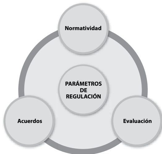
Gráfica 6.