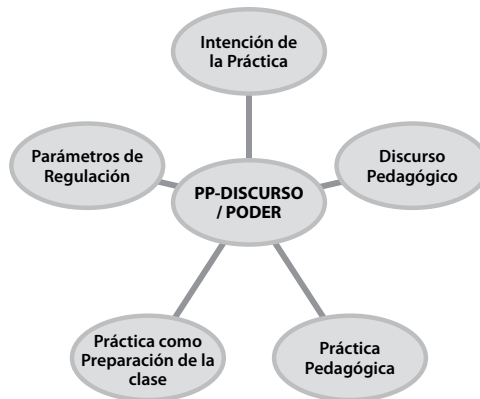
Gráfica 1.

A continuación se enuncian las categorías de análisis que guiarán las interpretaciones del presente estudio: