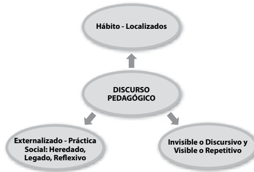
Gráfica 3.

cultura pedagógica predominante o legitimada; en la cual se formaron como docentes que transmiten el conocimiento y reproducen la cultura.