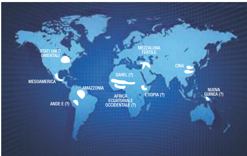
Tabla N 1. Algunos ejemplos de domesticación de plantas y animales en el mundo.