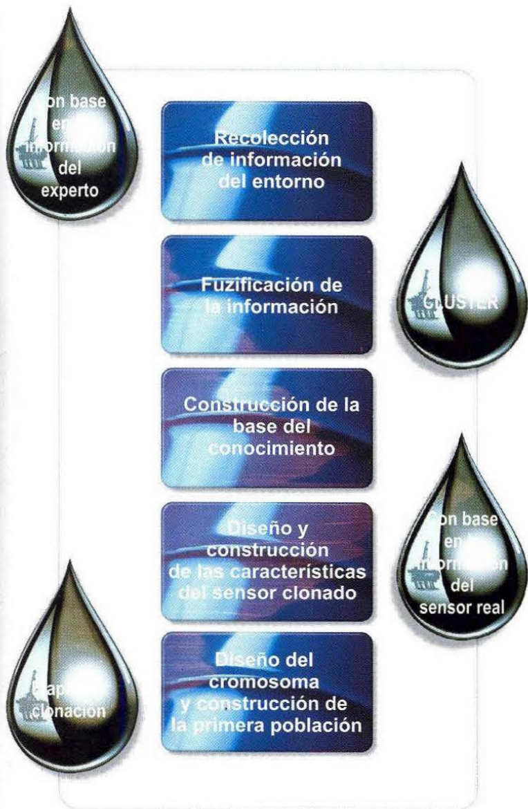
Gráfica 1. Secuencia desde la recolección de la información del entorno hasta la generación de la primera población.

En la gráfica anterior se muestra el diagrama de bloques de las etapas propuestas por los investigadores para diseñar y construir la primera población de cromosomas; desde la recolección de la información del entorno del sensor real, hasta el diseño de los fenotipos componentes del genotipo que se procesará mediante algoritmos genéticos (AGs) para obtener el primer sensor clonado, el cual será sometido a refinación hasta su convergencia para lograr la réplica.