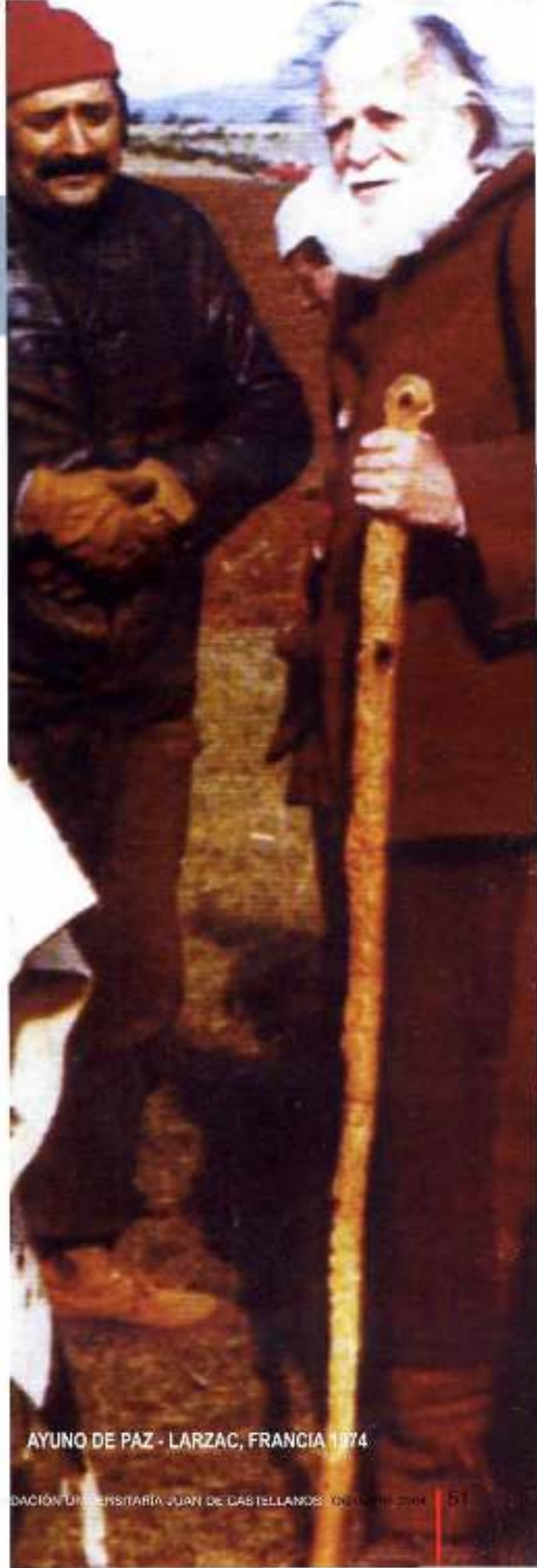
AYUNO DE PAZ - LARZAC, FRANCIA 1974.