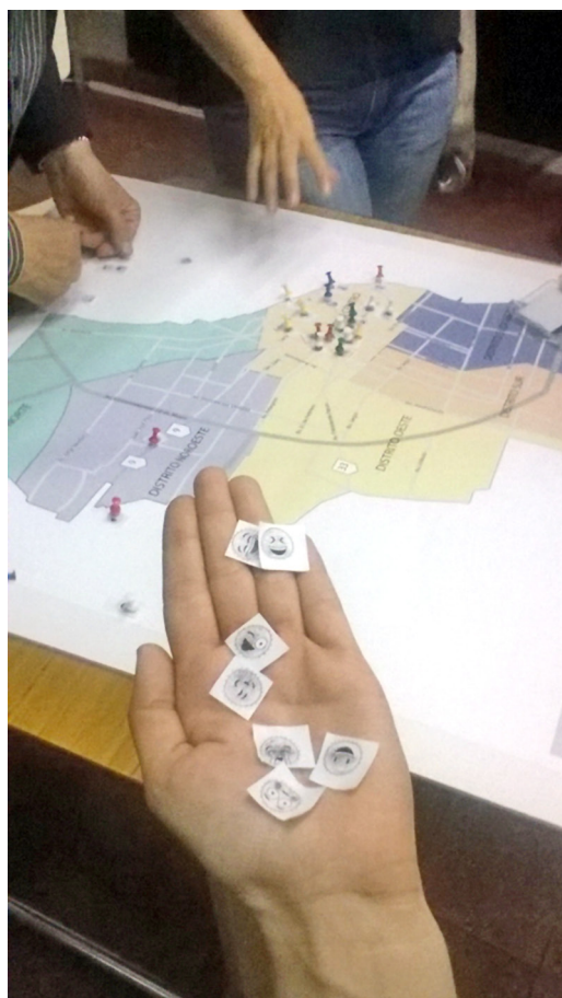
Figura 5. Discutiendo la ocurrencia de los DSS. Mapa Facultad de Medicina y Ciencias de la Salud, UAI, Rosario