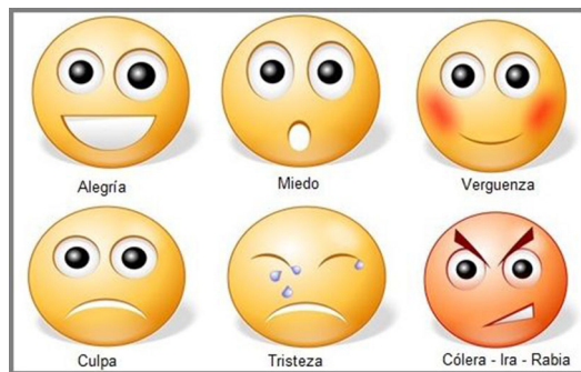
Figura 3. Pictogramas de las emociones