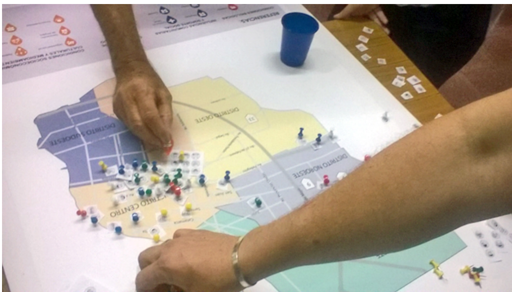
Figura 4. Situando los signos de los DSS en el territorio, mapa Facultad de Medicina y Ciencias de la Salud, UAI, Rosario

de la propuesta y explicitación del propósito; descripción del territorio habitado representado por la gráfica simplificada sobre una superficie bidimensional plana (figura 1); identificación de los DSS, elección de las emociones (emoticones) que representan una expresión del rostro con el objetivo de aludir a un estado anímico (figura 3) en sus recorridos cotidianos por la ciudad. La pregunta convocante fue: ¿qué sensaciones vivencian en una jornada laboral en el trayecto que circulan desde que salen de su hogar hasta que regresan?