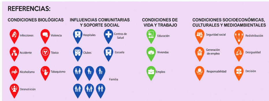
Figura 2. Pictogramas de DSS