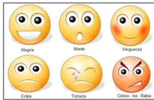
Figura 3. Pictogramas de las emociones.