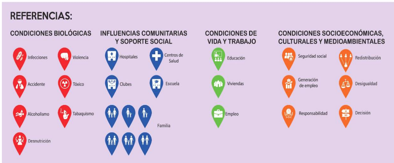
Figura 2. Pictogramas de DSS.