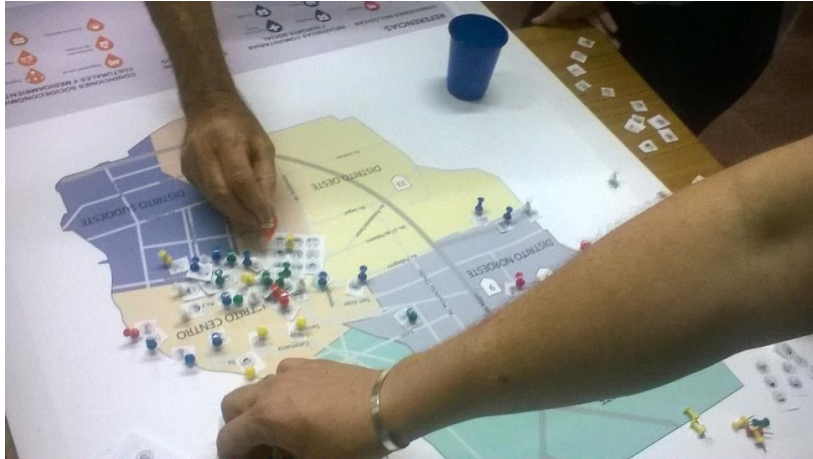
Figura 4. Situando los signos de los DSS en el territorio, mapa Facultad de Medicina y Ciencias de la Salud, UAI, Rosario.