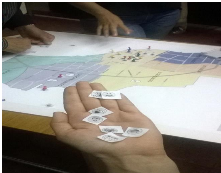
Figura 5. Discutiendo la ocurrencia de los DSS. Mapa Facultad de Medicina y Ciencias de la Salud, UAI, Rosario.

Reconstrucción de las vivencias territoriales y recorridos individuales y socialización.