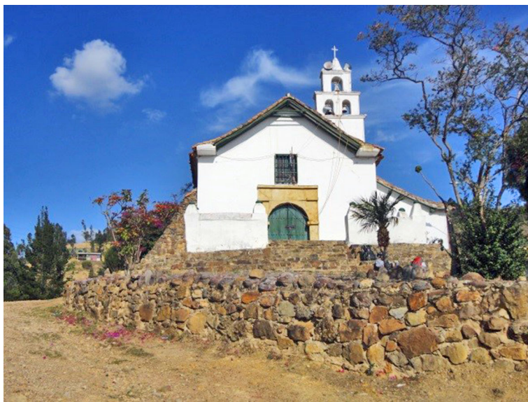
Figura 5. Capilla de San Isidro Labrador