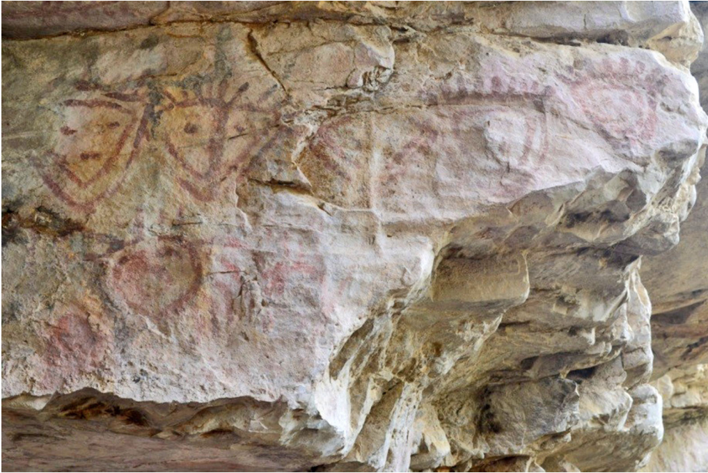
Figura 3. Pictografías de Sáchica, rostros humanos