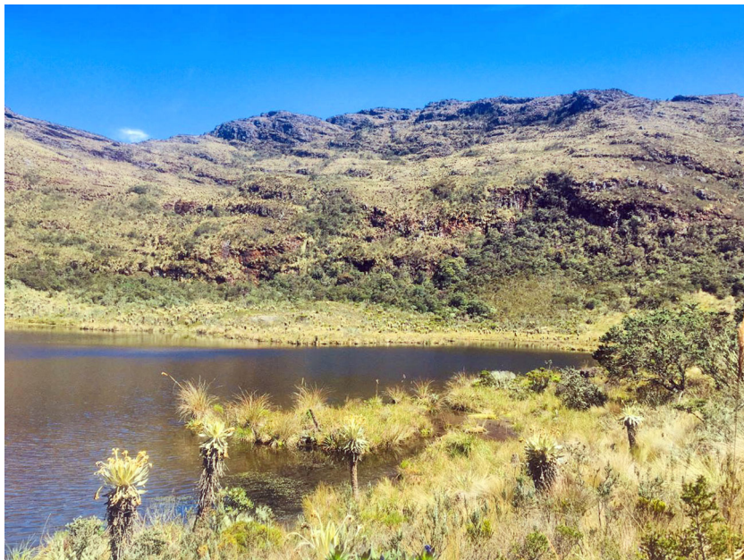
Figura 1. Laguna de San Pedro de Iguaque.