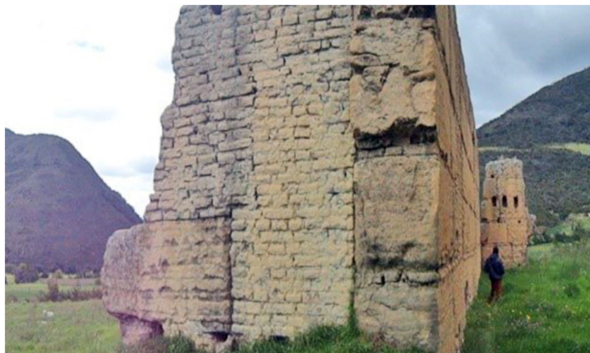
Figura 2. Ruinas de la capilla doctrinera de Iguaque