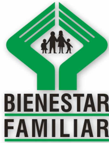
Figura 3 (ver ICBF, 2016 I)

La misión de la institución menciona que, quiere “trabajar [...] por el desarrollo y la protección integral de la primera infancia, la niñez, la adolescencia y el bienestar de las familias” (ICBF, 2016). Ni en la misión, ni en la visión, ni en los objetivos o en los pilares se encuentra una definición sobre la estructura familiar con la cual debe trabajar el instituto. La definición de familia está