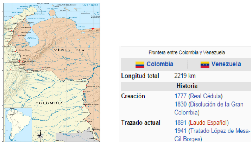
Mapa 1. División fronteriza: tratado López de Mesa-Gil Borges