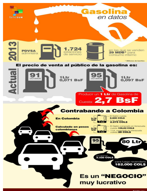
Figura 1. Fluctuaciones de venta de gasolina países. Información recuperada de Tele sur, otridad del conflicto colombo. Venezolano. 2014.

Gasolina: la más barata del mundo la tiene Venezuela mientras que en Colombia es de las más caras del planeta. Mientras los venezolanos pagan 7,76 Bolívares por llenar un tanque de 80 litros, en Colombia equivale a más de 2.100 Bolívares.