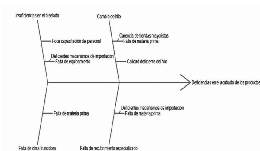
Figura 3. Diagrama causa-efecto.