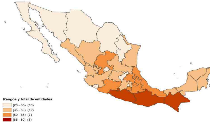
Figura 1. Porcentaje de población en pobreza, según entidad federativa, Estados Unidos Mexicanos, 2014.

cual hace que algunos municipios como los de Puebla presenten condiciones similares a regiones, de otras latitudes como oriente medio o algunas regiones de África. Presentamos un mapa de los estados con mayor concentración de pobreza.